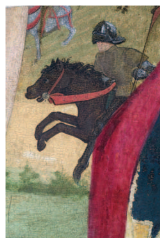
9 - Le Retable du Parlement de Toulouse, détail.