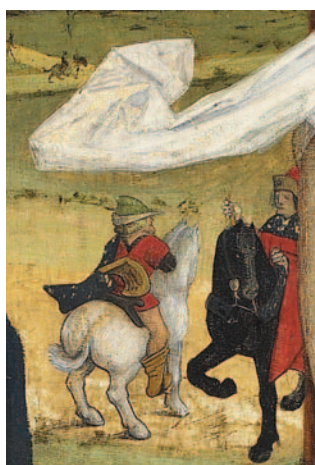
11 - Le Retable du Parlement de Toulouse, détail.