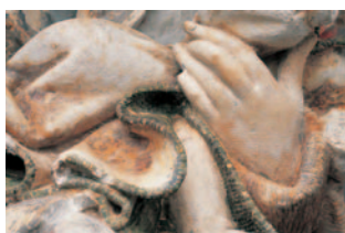
8 - Nostre Dame de Grasse, détail. © musée des Augustins, Toulouse. Photo : Daniel Martin.