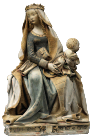
1 - Nostre Dame de Grasse. © musée des Augustins, Toulouse. Photo : Dominique faunières.