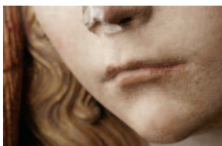
6 et 7 - Nostre Dame de Grasse, détail. © musée des Augustins, Toulouse. Photo : Daniel Martin.