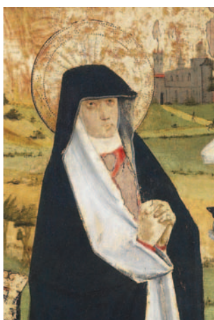
12 - Le Retable du Parlement de Toulouse, détail.