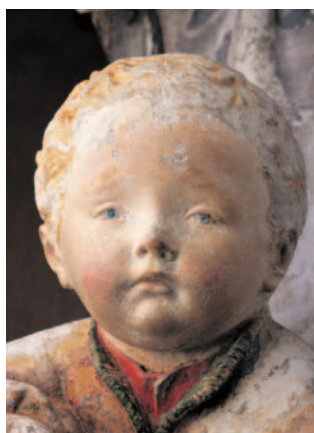
5 - Nostre Dame de Grasse, détail.