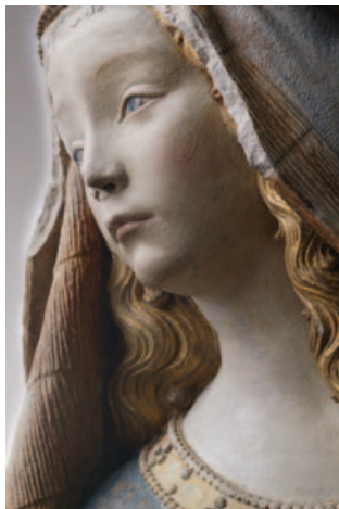
3 - Nostre Dame de Grasse, détail.