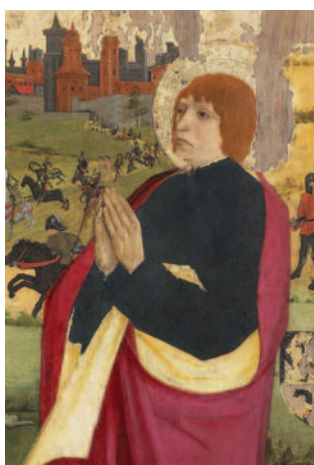
10 - Le Retable du Parlement de Toulouse, détail.