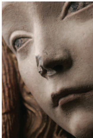
2 - Nostre Dame de Grasse, détail. © musée des Augustins, Toulouse. Photo : Daniel Martin.